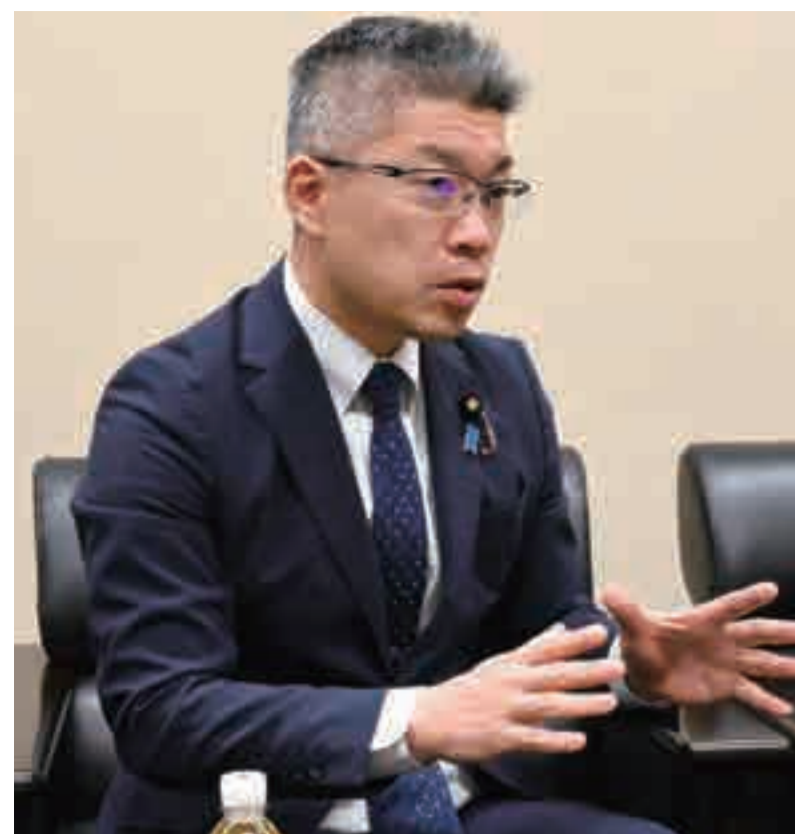
藤井 一博 参議院議員

「医療はお金がかかる、コロナで儲かったから取り上げる」といったように受け取れる議論