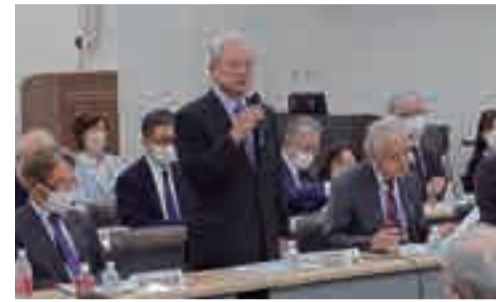
東京都医師会地区医師会会長会議にて挨拶