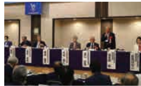
九州医師会連合会にて挨拶