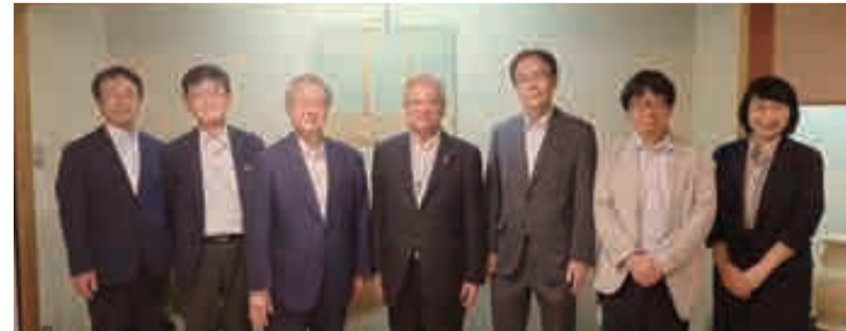
鹿児島県医師会役員との意見交換