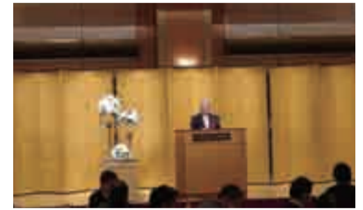
中国四国医師会連合会にて挨拶