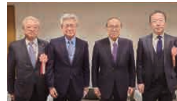
北海道医師会創立76周年に出席