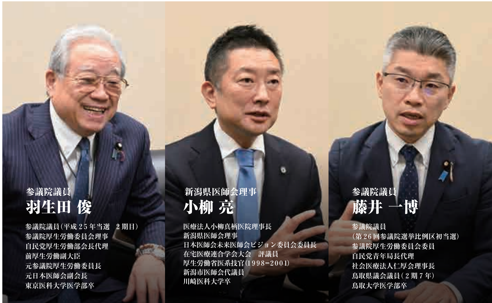
参議院議員 羽生田 俊

羽生田たかし国会事務所 〒100-8962 東京都千代田区永田町2-1-1 参議院議員会館319号室 TEL:03-6550-0319 FAX:03-6551-0319 羽生田たかし群馬事務所 〒371-0022 群馬県前橋市千代田町2-10-13 TEL:027-289-8680 FAX:027-289-8681