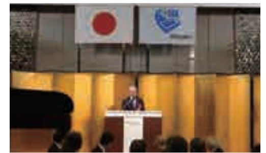
十四大都市医師会連絡協議会にて挨拶