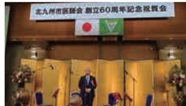
北九州市医師会創立60周年にて挨拶