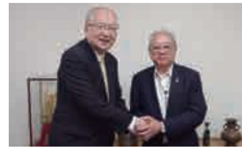
大阪府医師会高井会長と