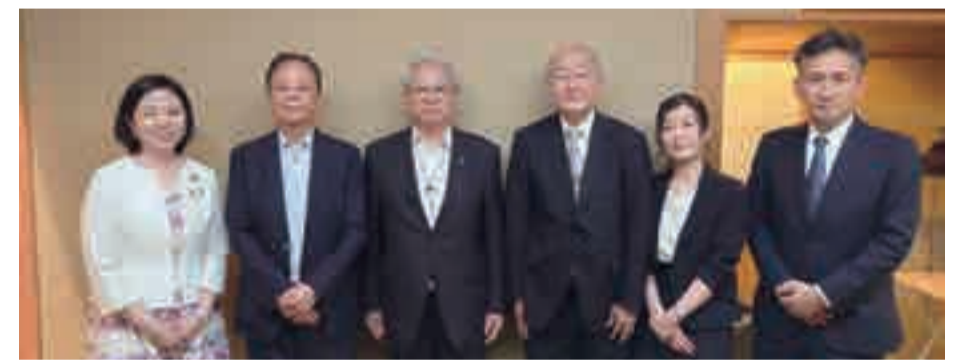
大分県医師会役員との意見交換