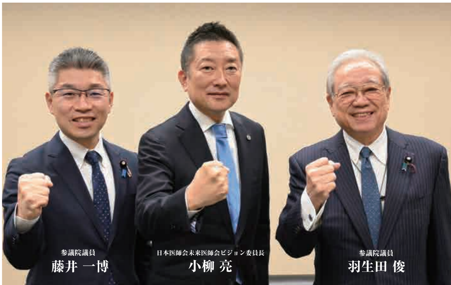
参議院議員 藤井 一博