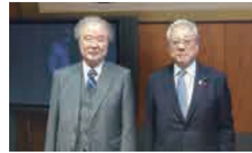
長崎県医師会森崎会長と