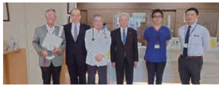
高知県医師会野並会長と医療機関訪問